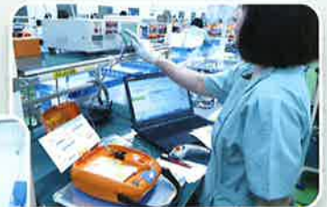
いくつもの検査をクリア