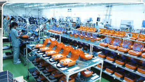
清浄空気によるクリーンな環境で生産