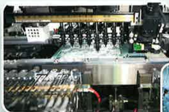
重要部品であるプリント基板もすべて自社生産

AEDの設置後は、いざという時にいつでも使用できるよう、さまざまな機能やサービスをご用意。 大切な命を守るために必要不可欠な保守管理についても 国産メーカーの強みを活かし、きめ細かなサポート体制でお応えします。