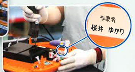
組み立てた作業員の責任と誇りの証・ネームラベル